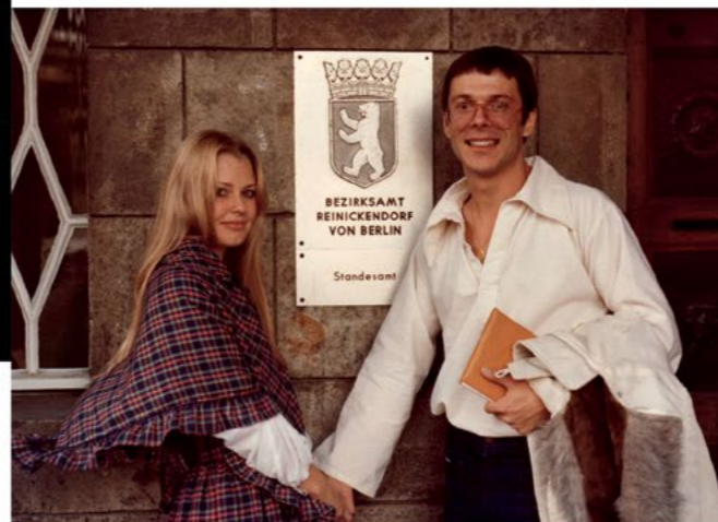
Eheschließung mit Hella, Mutter seines Sohnes.

LP „Menschenjungen“, 30-Städte-Frankreich Tournee. 72-Städte-Tournee durch Deutschland, Österreich und die Schweiz. Veröffentlichung der Liedersammlung „Von Anfang an“ (Voggenreiter-Verlag), die die bislang geschriebenen ca. 180 deutschen und französischen Lieder enthält.